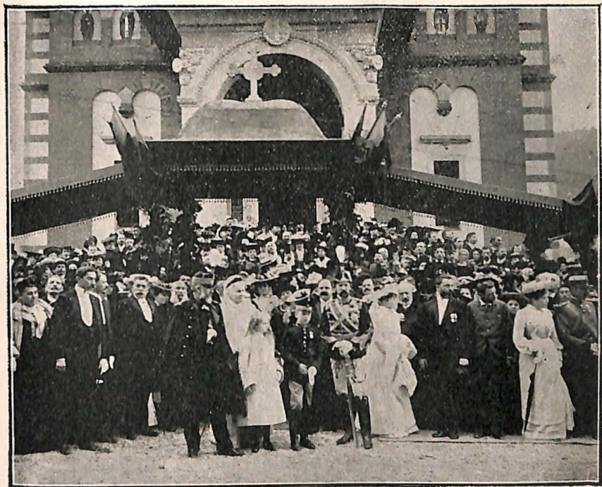
Festivitatea tîrnosirei Mînăstirei Sinaia

Vechea mănăstire are forma și stilul fondărei. Ea consistă din o bisericuță mică, paraclis și chiliile călugărilor și e încunjurată de-un zid, ca o citadelă. Călugării continuă aceeași viață cucernică de paznici și propagatori ai cuvîntului lui D-zeu. Ei stau sub conducerea unui archimandrit, o figură